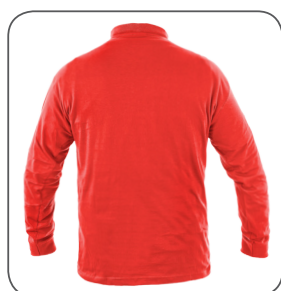
zadní strana back side odwrotna strona