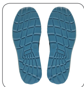
podešev outsole podeszwa