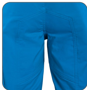
zesílený sed zosilnený sed reinforced seat wzmocnienie w kroku