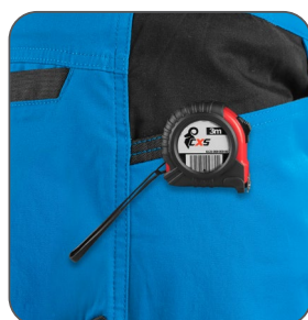
kapsa s vyztužením pro zavěšení metru vrecko s výstužou na zavesenie metra pocket with reinforcement for hanging a measuring tape kieszeń z wzmocnieniem do zawieszenia miarki