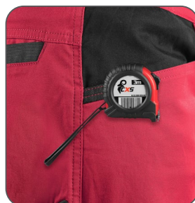
kapsa s vyztužením pro zavěšení metru vrecko s výstužou na zavesenie metra pocket with reinforcement for hanging a measuring tape kieszeń z wzmocnieniem do zawieszenia miarki