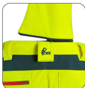
odepinací šle odnímateľné traky detachable braces odpinane szelki