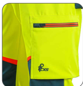
stehenní kapsa stehenné vrecko thigh pocket kieszeń na udzie