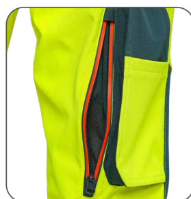
ventilace na stehně ventilácia na stehne thigh ventilation wentylacja na nogawce