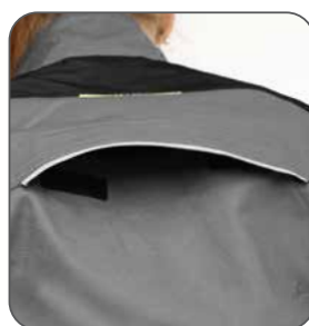
ventilace na zádech vetranie na zadnej strane ventilation on the back wentylacja z tyłu