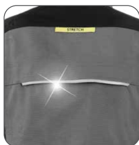
reflexní doplňky reflexné doplnky reflective accessories elementy odblaskowe