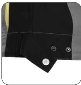
regulace v pase regulácia v páse adjustable waist regulowany pas