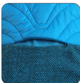
ventilace na zádech ventilácia na zadnej strane ventilation on the back wentylacja z tyłu