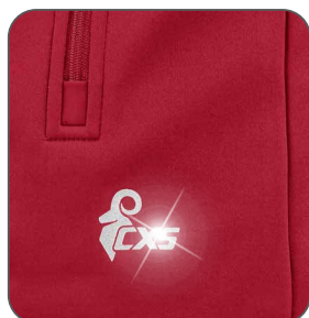
reflexní doplňky reflexné doplnky reflective accessories elementy odbłaskowe