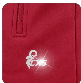
reflexní doplňky reflexné doplnky reflective accessories elementy odbłaskowe