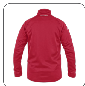
zadní strana zadná strana back side z tyłu