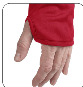
otvor na palec na rukávu otvor na palec na rukáve thumb hole on the sleeve otwór na kciuk na rękawie