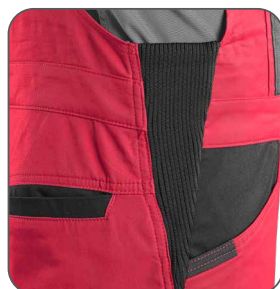
pruženka v bocích guma v bokoch elastic in the hips elastyczna gumka po bokach