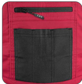
náprsní kapsy náprsné vrecká chest pockets kieszenie na piersi