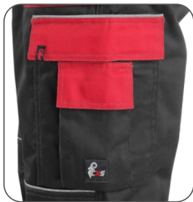
multifunkční kapsy multifunkčné vrecká multifunctional pockets kieszenie wielofunkcyjne