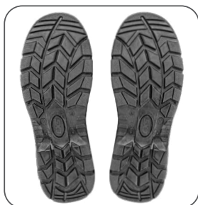
podešev podošva outsole podeszwa