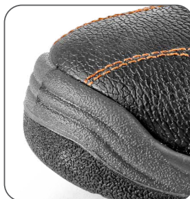
zesílená přední část proti okopu zosilnená predná časť proti okopu reinforced PU overcap nosek z PU wzmocnieniem