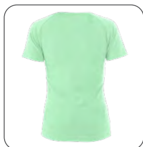
zadní strana zadná strana back side z tyłu