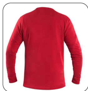
zadní strana zadná strana back side z tyłu