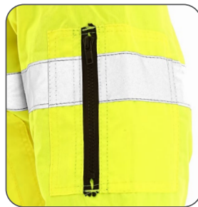
kapsa na rukávu vrecko na rukáve pocket on the sleeve kieszeń na rękawie