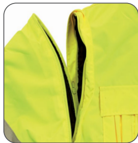
odepínací rukávy odnímateľné rukávy detachable sleeves odpinane rękawy