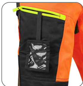
stehenní kapsa s vnitřním pouzdem na ID kartu stehenné vrecko s vnútorným držiakom na ID kartu thigh pocket with inner ID card holder kieszeń na udzie z miejscem na ID kartę