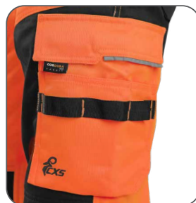
multifunkční kapsy multifunkčné vrecká multifunctional pockets kieszenie wielofunkcyjne