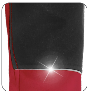
reflexní doplňky reflexné doplnky reflective accessories elementy odblaskowe