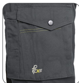
multifunkční kapsy na boku multifunkčné vrecká na boku multifunctional side pockets boczne kieszenie wielofunkcyjne