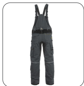
zadní strana zadná strana back side z tyłu