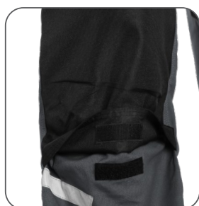
zesílená kolena s možností vložení výztuh reinforced knees with possibility to insert pads kolana wzmocnione z możliwością włożenia nakolanników