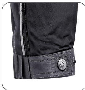
nastavitelná manžeta rukávu nastaviteľná manžeta rukáva adjustable cuff regulowany mankiet