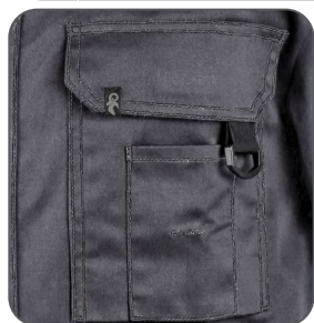
multifunkční kapsy multifunkčné vrecká multifunctional pockets kieszenie wielofunkcyjne