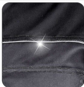
reflexní doplňky reflexné doplnky reflective accessories elementy odblaskowe