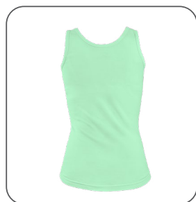
zadní strana zadná strana back side z tyłu