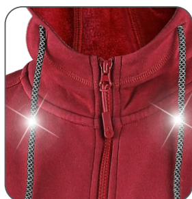
reflexní tkanice reflexné šnúrky reflective strings sznurówki odblaskowe