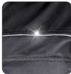
reflexní doplňky reflexné doplnky reflective accessories elementy odblaskowe