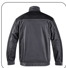
zadní strana zadná strana back side z tyłu