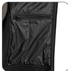
vnitřní kapsa vnútorné vrecko inner pocket kieszeń wewnętrzna