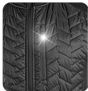
náprsní kapsa náprsné vrecko chest pocket kieszeń na piersi