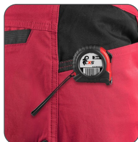
kapsa s vyztužením pro zavěšení metru vrecko s výstužou na zavesenie metra pocket with reinforcement for hanging a measuring tape kieszeń z wzmocnieniem do zawieszenia miarki