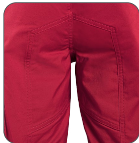
zesílený sed zosilnený sed reinforced seat wzmocnienie w kroku