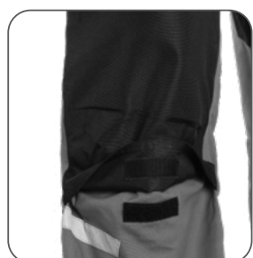
kolenní kapsy z 600D polyesteru vrecká na kolénach z polyesteru 600D 600D polyester knee pockets kieszenie na kolanach z poliestru 600D