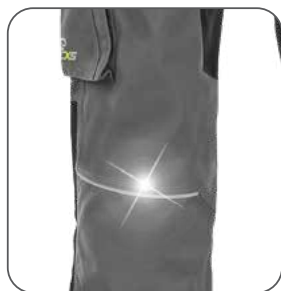
reflexní doplňky reflexné doplnky reflective accessories elementy odbłaskowe