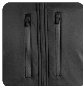
náprsní kapsy na zip náprsné vrecká na zips chest zippered pockets kieszenie na piersi na zamek