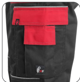
multifunkční kapsy multifunkčné vrecká multifunctional pockets kieszenie wielofunkcyjne