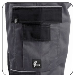
multifunkční kapsy multifunkčné vrecká multifunctional pockets kieszenie wielofunkcyjne