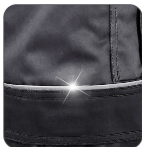
reflexní doplňky reflexné doplnky reflective accessories elementy odblaskowe