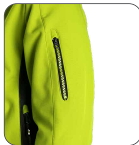
kapsa na rukávu vrecko na rukáve pocket on the sleeve kieszeń na rękawie