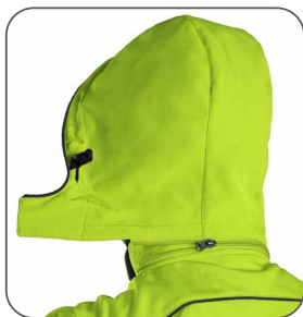
odepínací kapuce odnímateľná kapučňa detachable hood odpinany kaptur