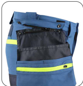
odepínací kapsy odpínacie vrecká detachable pockets odpinane kieszenie