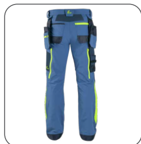
zadní strana zadná strana back side z tyłu