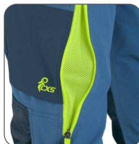
ventilace na stehně ventilácia na stehne thigh ventilation wentylacja na nogawce