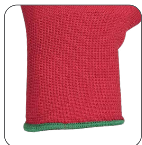
pružná manžeta pružná manžeta elastic cuff mankiet elastyczny