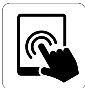
možnost ovládaní dotykových displejů ovládanie pomocou dotykovej obrazovky possibility to touch screen możliwość pracy z ekranami dotykowymi