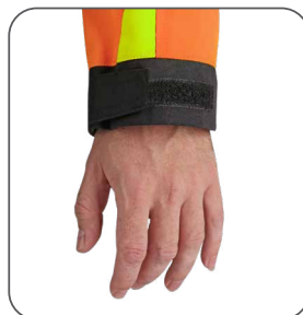
regulovaná manžeta nastavitelná manžeta adjustable cuff regulowany mankiet