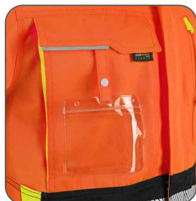
náprsní kapsa s odnímatelným pouzdrém ID karty náprsné vrecko s odnímateľným držiakom na ID kartu chest pocket with detachable ID card holder kieszeń na piersi z miejscem na ID kartę