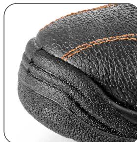
zesílená přední část proti okopu zosilnená predná časť proti okopu reinforced PU overcap nosek z PU wzmocnieniem