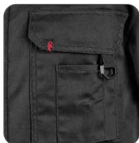
multifunkční kapsy multifunkčné vrecká multifunctional pockets kieszenie wielofunkcyjne