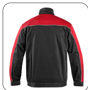
zadní strana zadná strana back side z tyłu