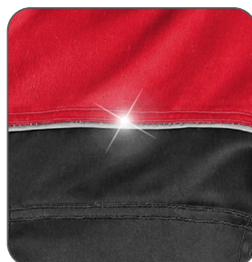
reflexní doplňky reflexné doplnky reflective accessories elementy odblaskowe