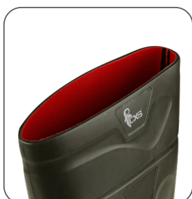
textilní podšívka textilná podšívka textile lining tekstylna podszewka