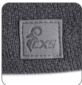
logo na pravé straně logo na pravej strane logo on the right side logo po prawej stronie