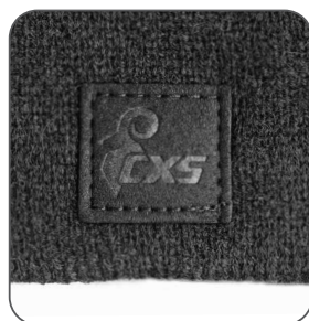
logo na pravé straně logo na pravej strane logo on the right side logo po prawej stronie